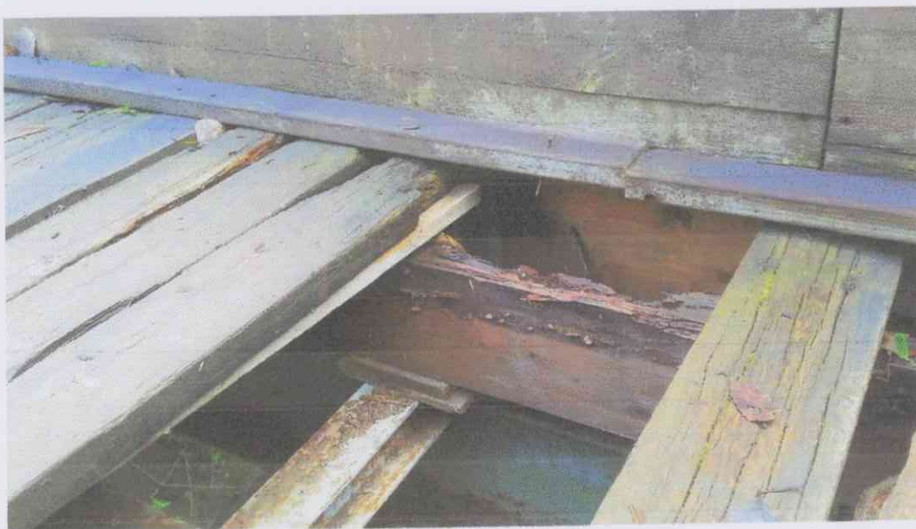
Fotogramma n. 5