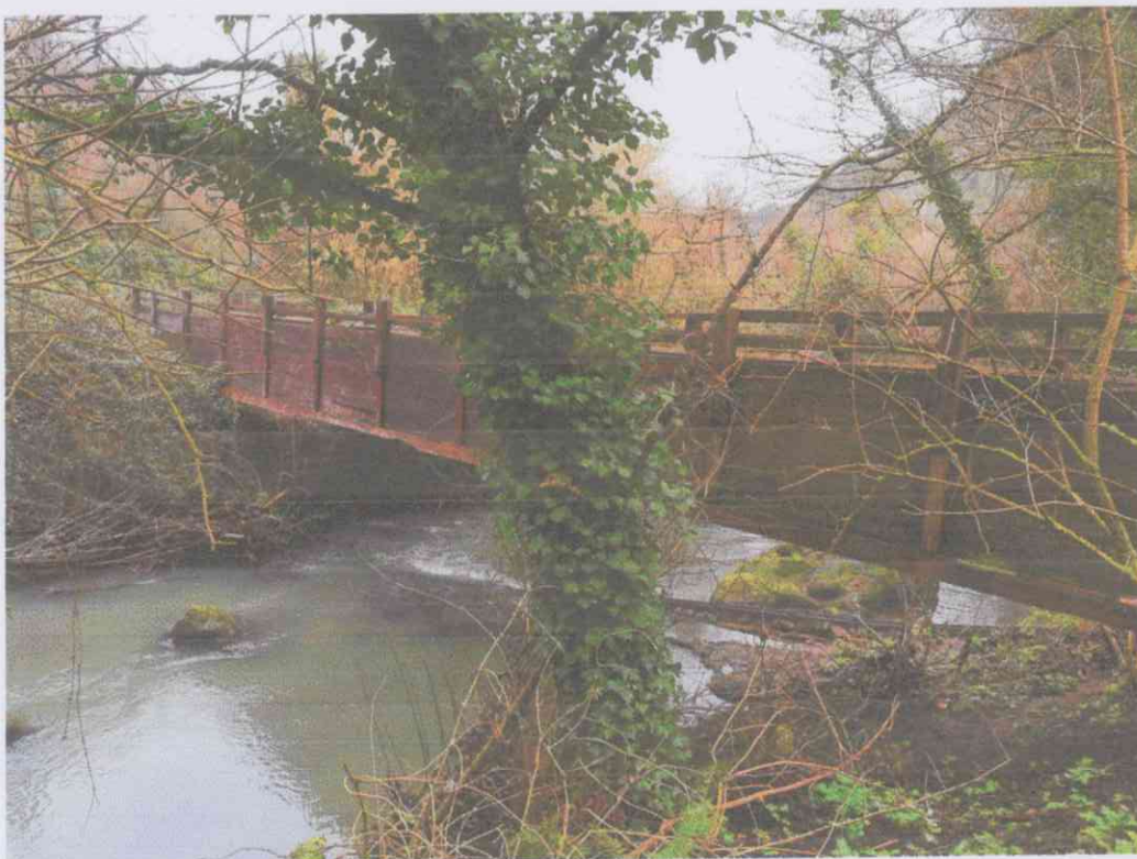
Fotogramma n. 1