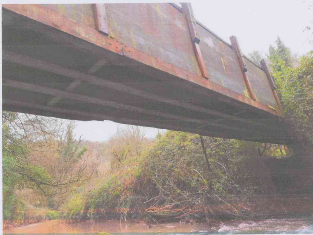
Fotogramma n. 2