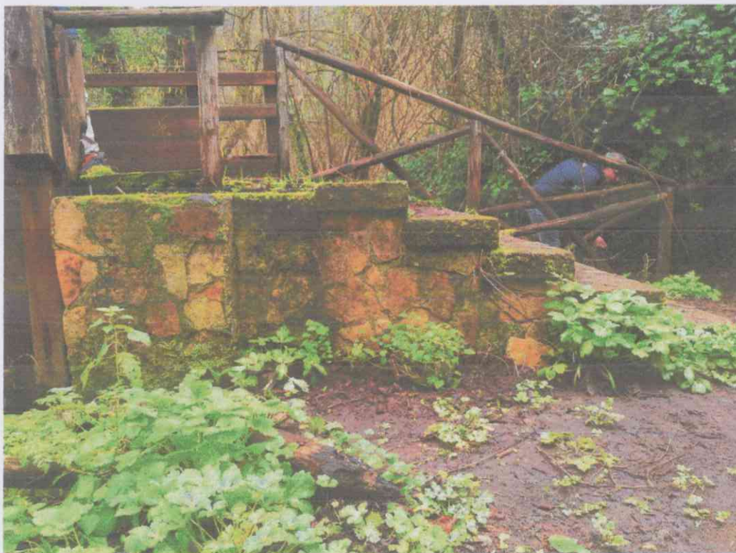
Fotogramma n. 3