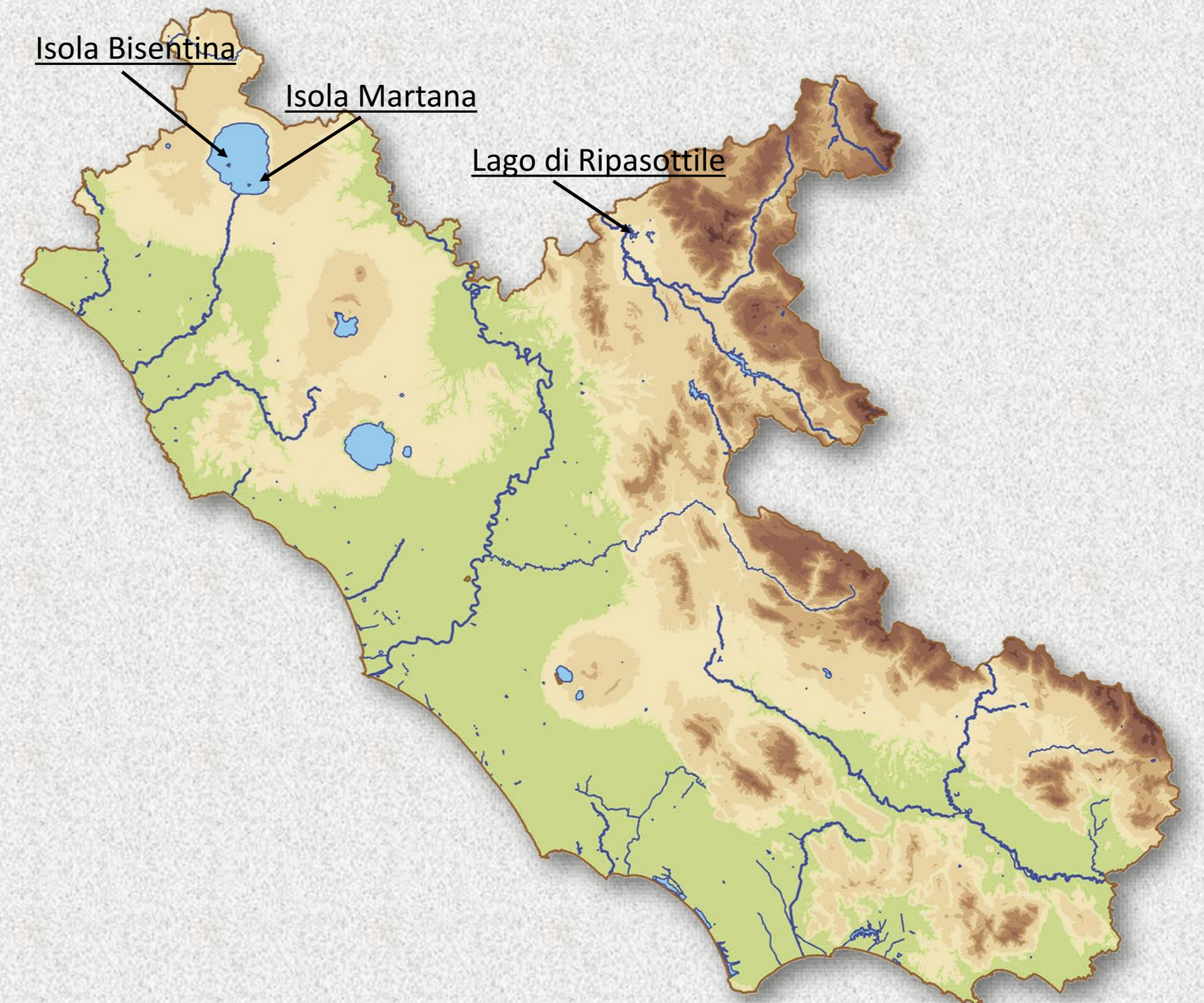
Fig. 1. Siti di nidificazione del Cormorano nel Lazio.

La colonizzazione dell'Isola Martana e il contemporaneo leggero decremento delle coppie nidificanti sull'Isola Bisentina farebbero supporre una possibile ripartizione della popolazione su quest'ultima isola; la colonizzazione del Lago di Ripasottile conferma la tendenza in atto della specie ad occupare nuove aree nell'Italia centrale (es. Umbria, Brunelli 2019).