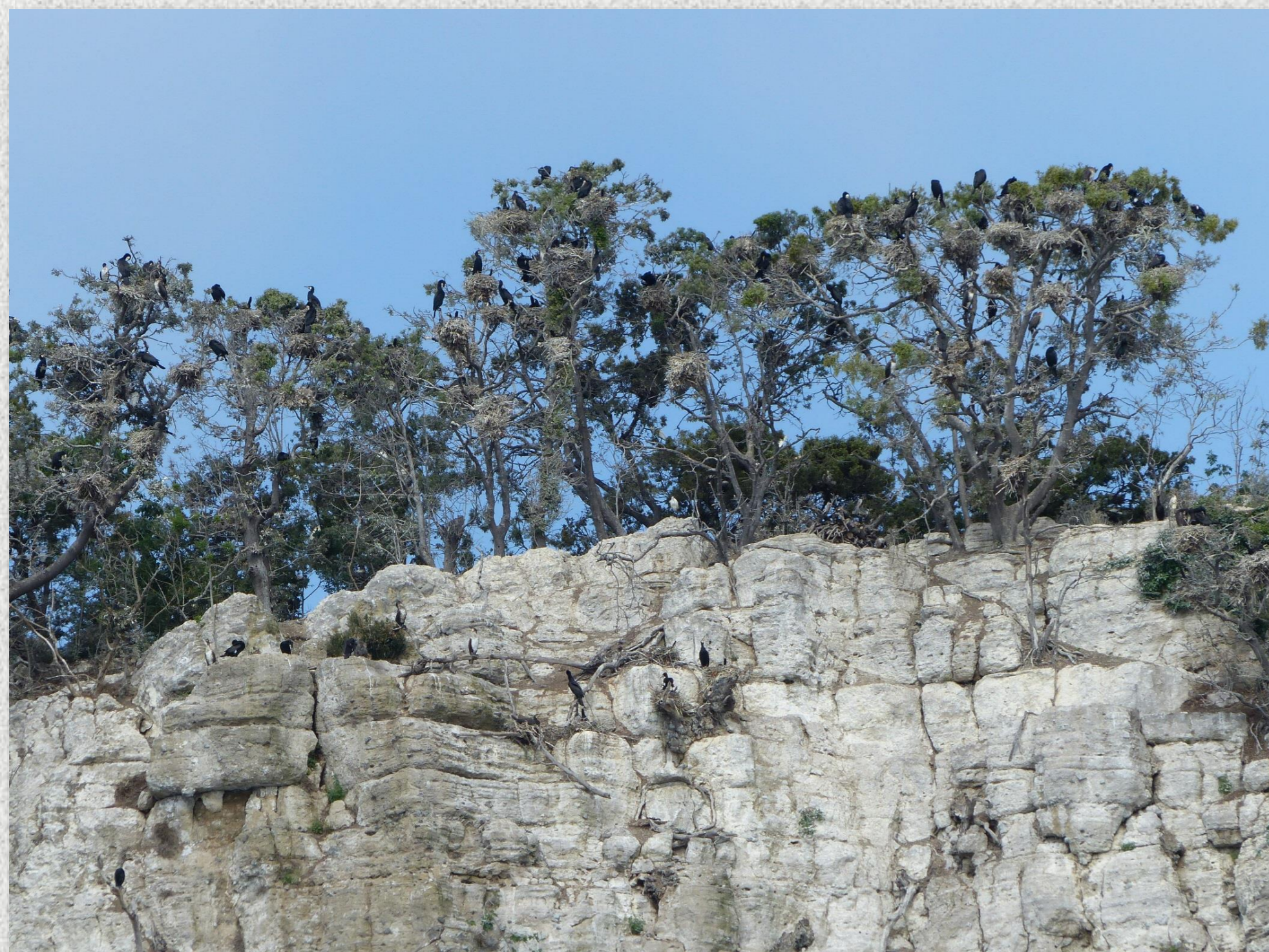
Sito di nidificazione dell'Isola Bisentina.