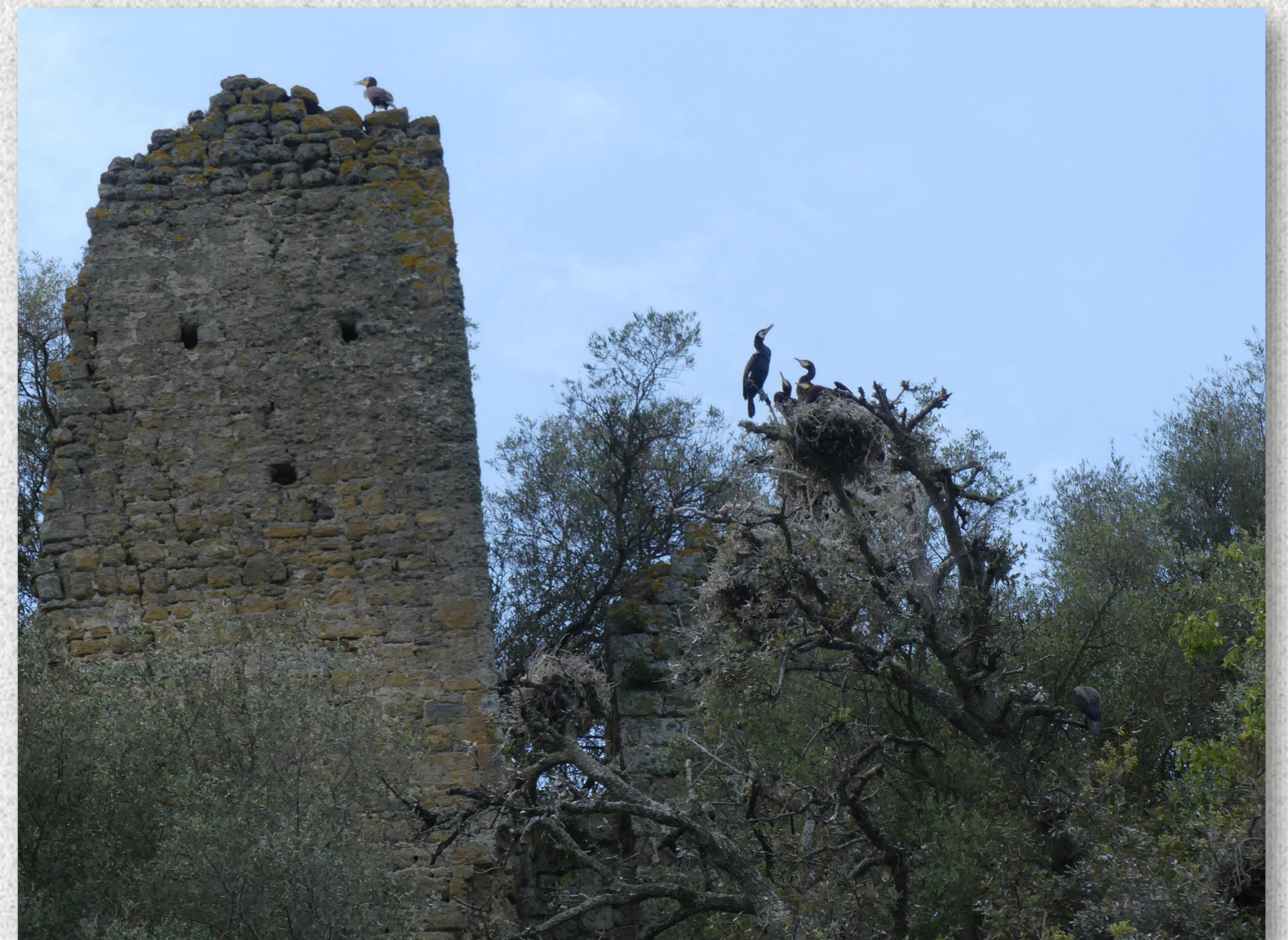
Sito di nidificazione dell'Isola Martana.