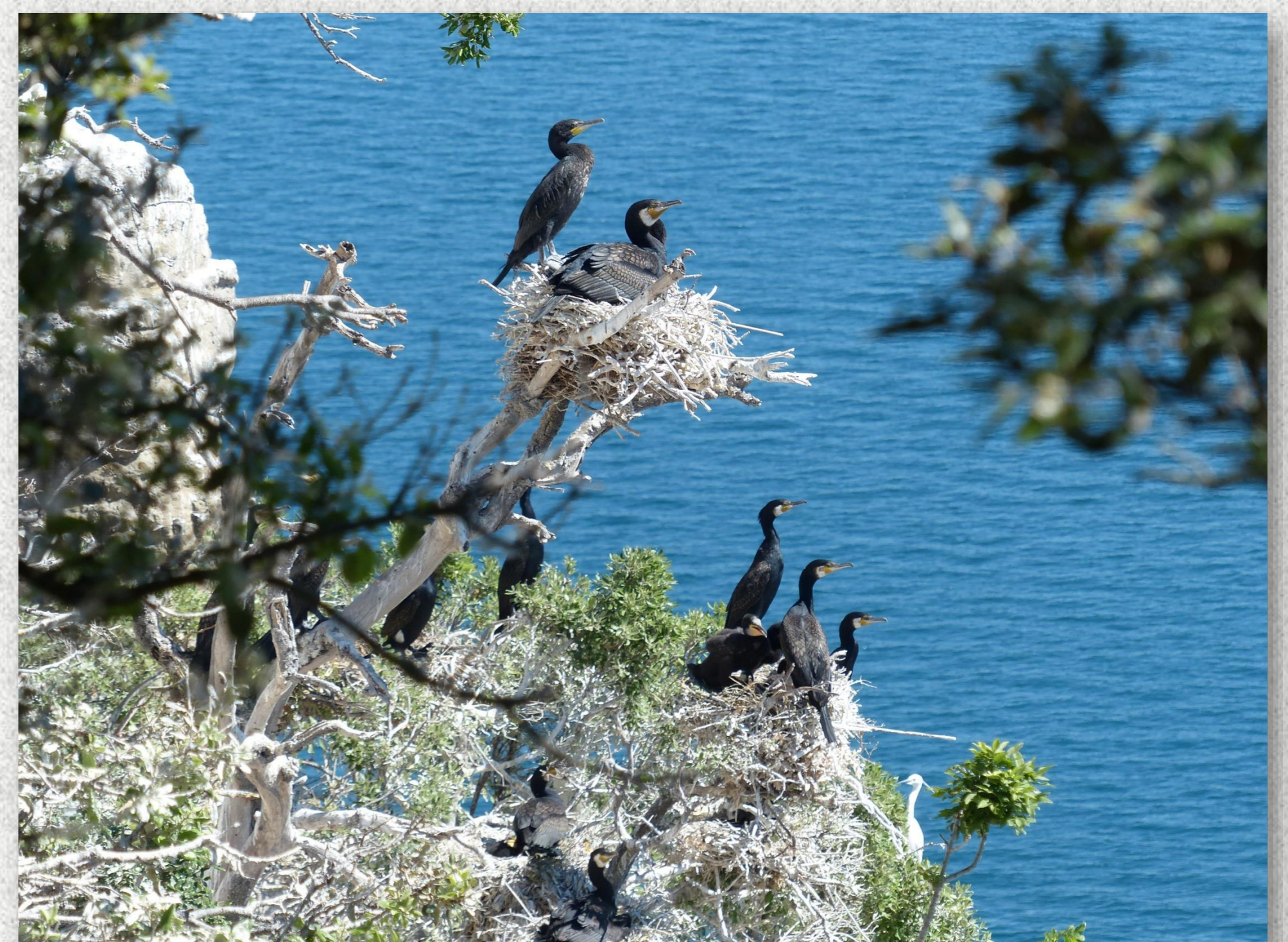
Cormorani in riproduzione nel sito del Lago di Bolsena