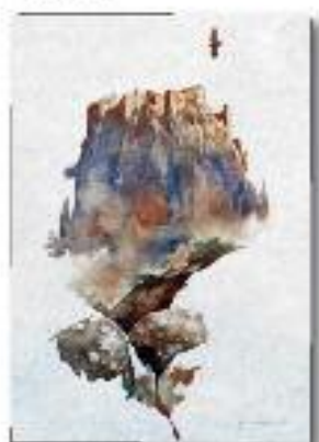
Calcata vista dal Treja