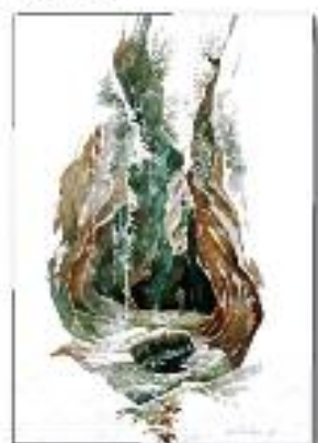
Fossa del Piccolo