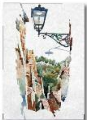
Mazzano R. loc. La Treccia