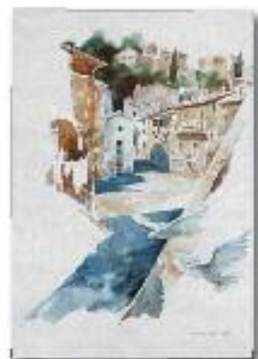
Mazzano R. Piazza Umberto I