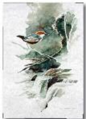
Cascate di Monte Gelato