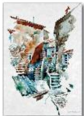
Calcata via Porta segreta