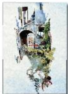
Calcata via Ripa Rollo