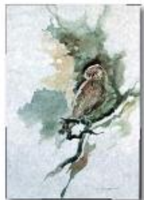
Calcata vista da Santa Maria