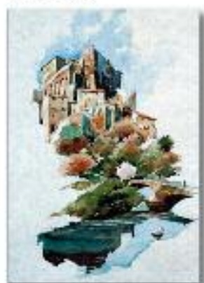
Mazzano R. ponte sul Treja