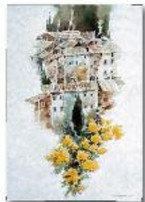
Mazzano R. vista da Caslelli