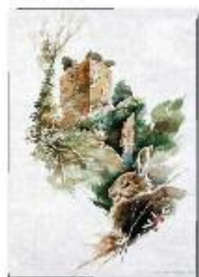
Santa Maria di Castelvecchio