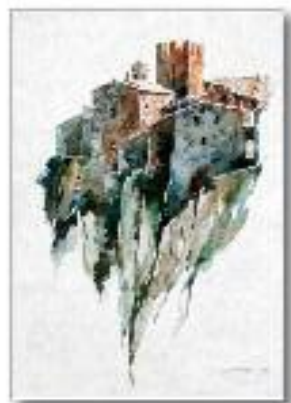
Calcata Palazzo baronale