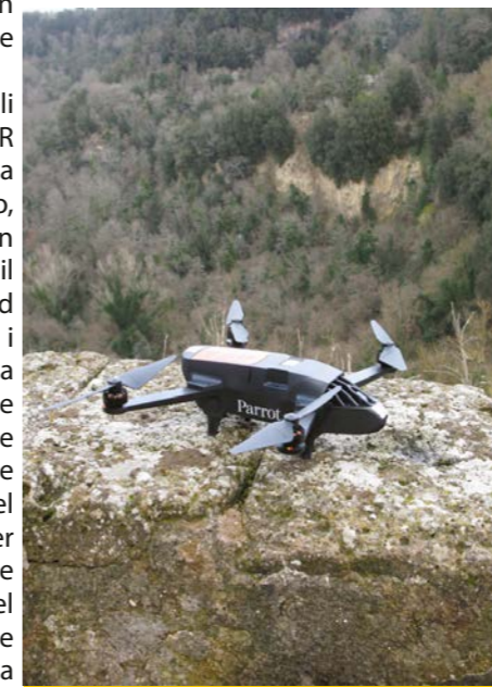
Il nuovo drone con sensori multispettrali

A partire dal 2016 il Parco ha in dotazione un drone che in questi anni è stato impiegato, grazie all'analisi fotointerpretativa, in attività istituzionali di controllo e vigilanza, rilevamento territoriale, monitoraggio ambientale e naturalistico, nel Parco Valle del Treja ed in altre Aree Protette della Regione Lazio. Numerosi i voli effettuati con l'APR (Aeromobile a Pilotaggio Remoto, così è definito in linguaggio tecnico il drone), utilizzato ad esempio per i monitoraggi della nidificazione delle tartarughe marine lungo il litorale settentrionale del Lazio, per l'abbassamento delle acque del lago, nel Parco di Bracciano e Martignano, per la salute dei boschi di