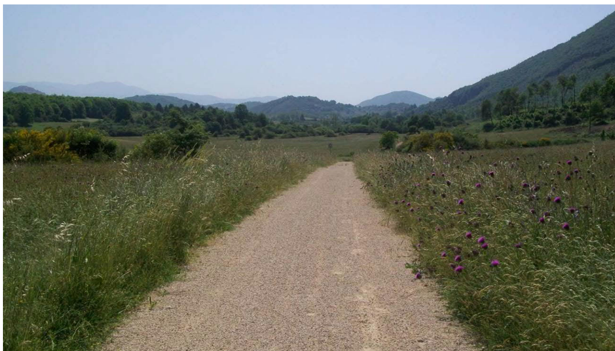
Foto 1, Sentieristica Fonte Anticolana - Lago di Canterno

Le opere relative al tracciato in progetto, infatti, si inseriscono in un più ampio quadro di interventi volti alla definizione di un sistema organico di percorsi ciclabili, di cui fanno parte la pista che si snoda lungo l'ex tracciato ferroviario Fiuggi - Roma, per lo più parallelamente alla via Prenestina, da Fiuggi a Paliano e quella che da questo punto prosegue fino a Cave, la pista polifunzionale all'interno del SIC dei Castagneti di Fiuggi, nonché la sentieristica di collegamento che da questa si articola in tre tracciati distinti: il tratto che parte dalla Fonte Anticolana ed